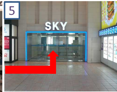
5 スカイビル入り口を入ります。