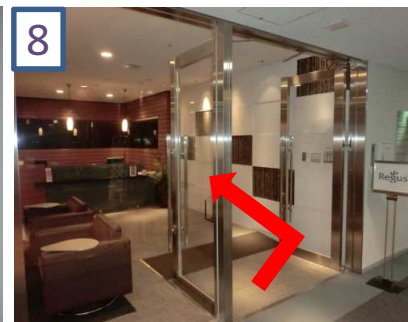
8 リージャスビジネスセンター 内の受付で税務相談にいらした旨をお伝えください。