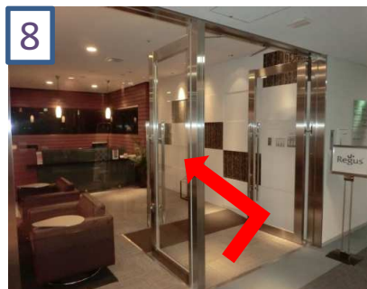
8 リージャスビジネスセンター 内の受付で税務相談にいらした旨をお伝えください。