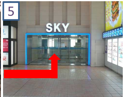
5 スカイビル入り口を入ります。