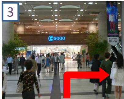
3 「SOGO」手前を右に曲がります。