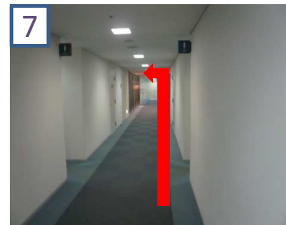
7 真っ直ぐ進んでいただき、左手(奥手前)を入ります。