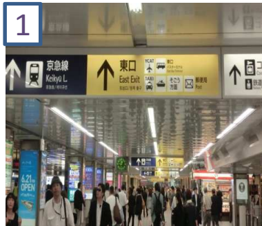
1 横浜駅東口を出ます。