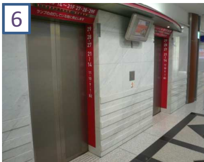
6 「赤」のエレベーターで20階へ上がります。