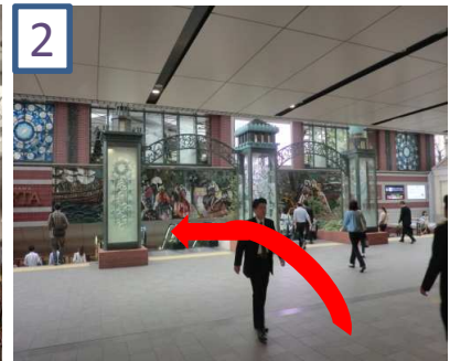
2 東口地下街「ポルタ」の階段を降り、しばらく直進します。