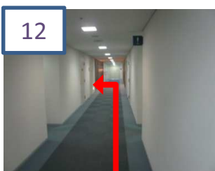
12 真っ直ぐ進んでいただき、左手(奥手前)を入ります。