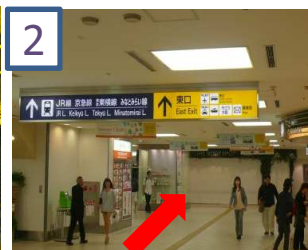
2 案内掲示に従って東口へ向かいます。