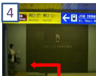
4 「UNITED ARROWS」の看板を左に曲がります。