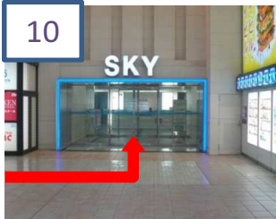
10 スカイビル入り口を入ります。