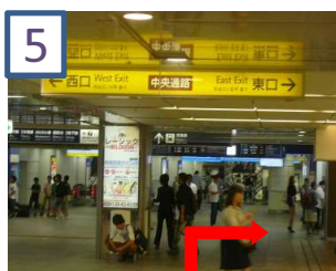
5 中央通路を右に曲がります。