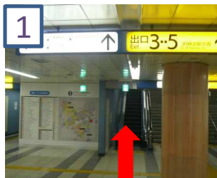
1 改札を出て、エスカレーターをあがります。