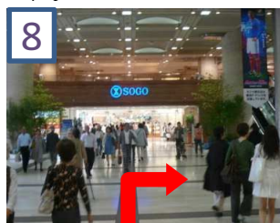
8 「SOGO」手前を右に曲がります。