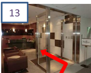
13 リージャスビジネスセンター 内の受付で税務相談にいらした旨をお伝えください。