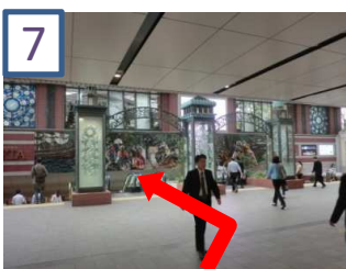
7 東口地下街「ポルタ」の階段を降り、しばらく直進します。