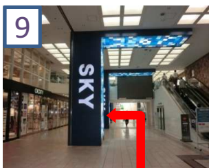
9 「SKY」の看板の横を通過すると左に入り口が見えます。