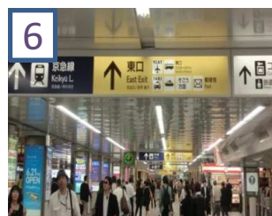
6 横浜駅東口を出ます。