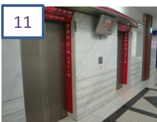
11 「赤」のエレベーターで20階へ上がります。