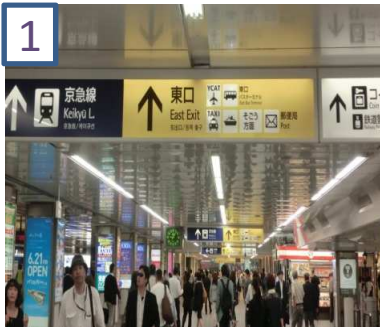
1 横浜駅東口を出ます。