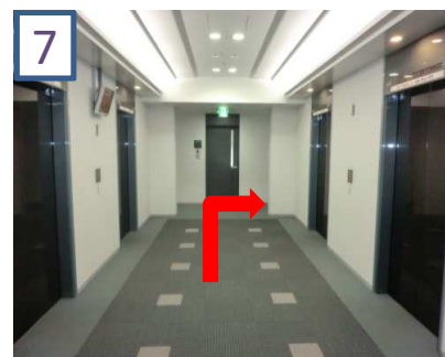
7 エレベーターを降り、近い方の突きあたりを右へ曲がります。