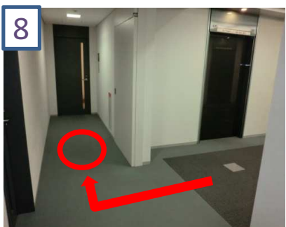
8 ○の辺りでお待ちください。税理士がお迎えに上がります。 ※エントランスには鍵がかかっておりますので向かわないようご注意ください。 ※リージャスビジネスセンター内に相談所がございます。