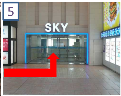
5 スカイビル入り口を入ります。