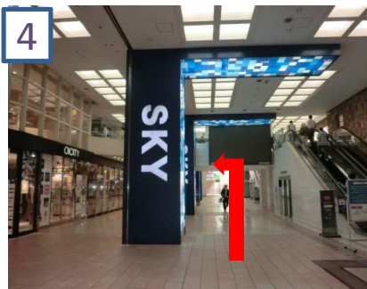
4 「SKY」の看板の横を通過すると左に入口が見えます。