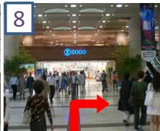
「SOGO」手前を右に曲がります。