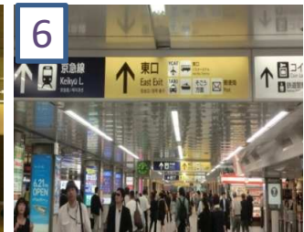
横浜駅東口を出ます。