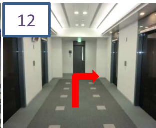
エレベーターを降り、近い方の突きあたりを右へ曲がります。