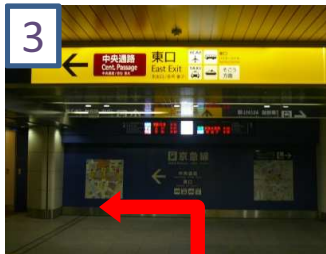
突きあたりの京急線の案内を左に曲がります。