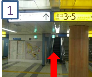
改札を出て、エスカレーターをあがります。