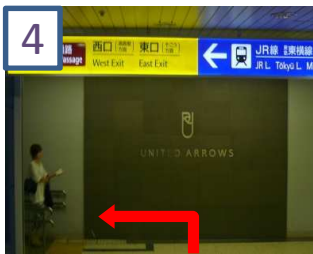
「UNITED ARROWS」の看板を左に曲がります。