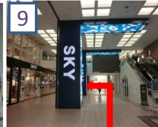
「SKY」の看板の横を通ると左に入り口が見えます。