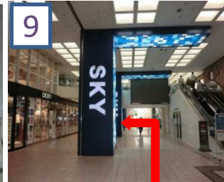
「SKY」の看板の横を通ると左に入り口が見えます。