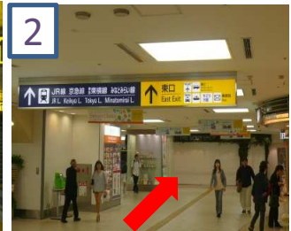
案内掲示に従って東口へ向かいます。