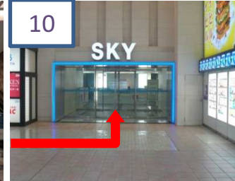
スカイビル入り口を入ります。