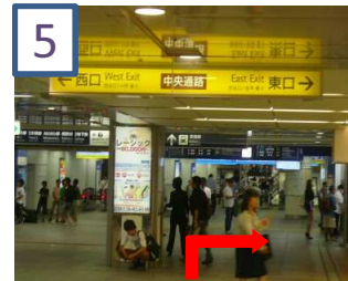
中央通路を右に曲がります。