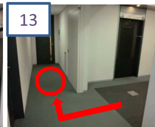
○の辺りでお待ちください。税理士がお迎えに上がります。 ※エントランスには鍵がかかっておりますので向かわないようご注意ください。 ※リージャスビジネスセンター内に相談所がございます。