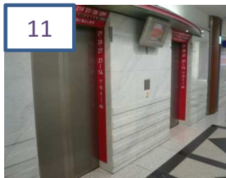
「赤」のエレベーターで20階へ上がります。